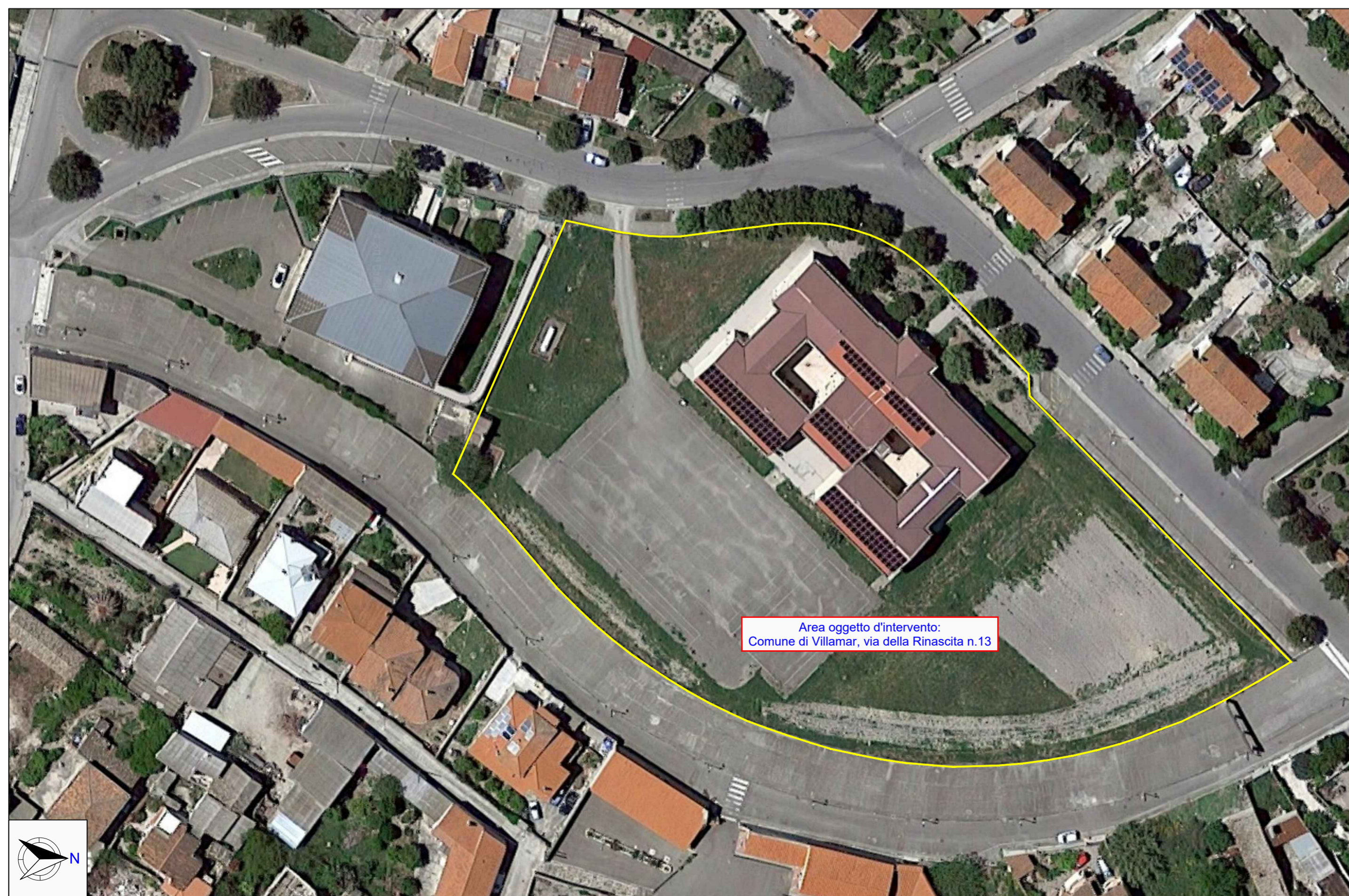
COMUNE DI VILLAMAR - FOTO AEREA